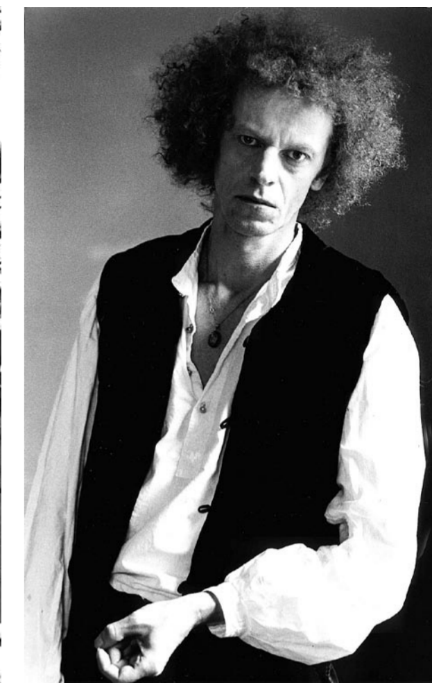
Bruno K Öijer är en av Sveriges mest hyllade poeter. Han föddes 1951 i Linköping och har gett ut nio diktsamlingar och en roman.

► "Det här slutar väl med att vi bygger upp den där gården igen, jag kommer ner med en spade", hälsar Öijer.